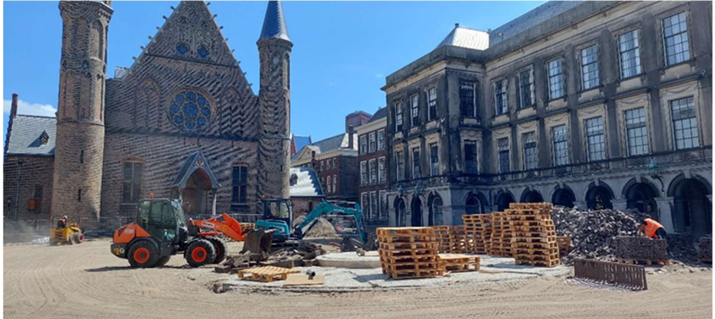
Ontmanteling Binnenhoffontein, Michiel Hartkamp

Ook is in deze periode de Binnenhoffontein op het Opperhof ontmanteld en is de stenen bestrating verwijderd en naar de opslag gebracht. Naast de uitpandige werkzaamheden worden de gebouwen inpandig bouwgereed gemaakt: her te gebruiken onderdelen zoals stalen plafondplaten zijn ontmanteld en opgeslagen; kwetsbare delen van de complexen worden uitgenomen en ingetimmerd ter bescherming. Ook hebben er in verschillende complexdelen inpandige asbest onderzoeken en saneringen plaatsgevonden.