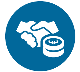
Een sterkere economie, sociale rechtvaardigheid en werkgelegenheid