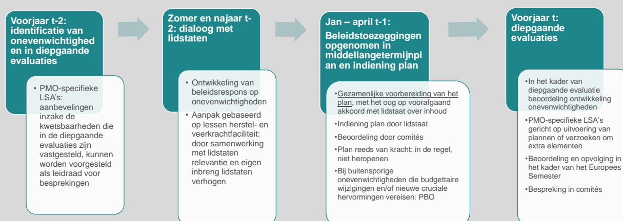
Figuur 1: Tijdschema voor de beleidsreactie op de vaststelling van een onevenwichtigheid met een nieuw nationaal middellangetermijnplan

Tijdens de looptijd van het nationale middellangetermijnplan worden nieuwe onevenwichtigheden gevonden.