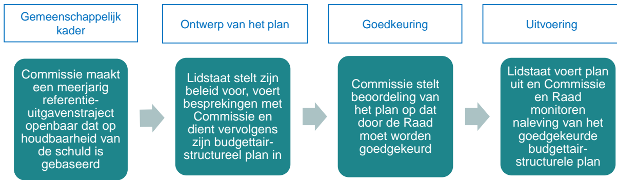
Figuur 3: Overzicht van het proces