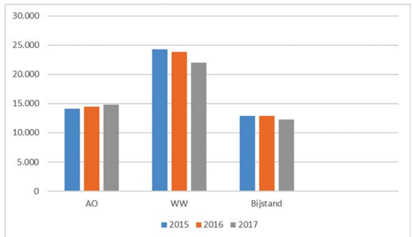
Figuur 2: Personen met een AO, WW- of bijstandsuitkering 2015–2017 afkomstig uit de EU-27 (exclusief exportuitkeringen)

Van de 315 duizend mensen die in december 2017 in Nederland een WW-uitkering ontvingen is 7% afkomstig uit de EU-27. De grootste groep EU-burgers in de WW zijn Poolse WW-gerechtigden met 13.000 personen oftewel 4% van het totale aantal ww-ers. Het aantal WW-uitkeringen van arbeidsmigranten is gedaald. Voor Polen is deze daling 1.330 ten opzichte van eind 2016. Het merendeel van de export van WW-uitkeringen betreft evenals in eerdere jaren ook in 2017 Polen.