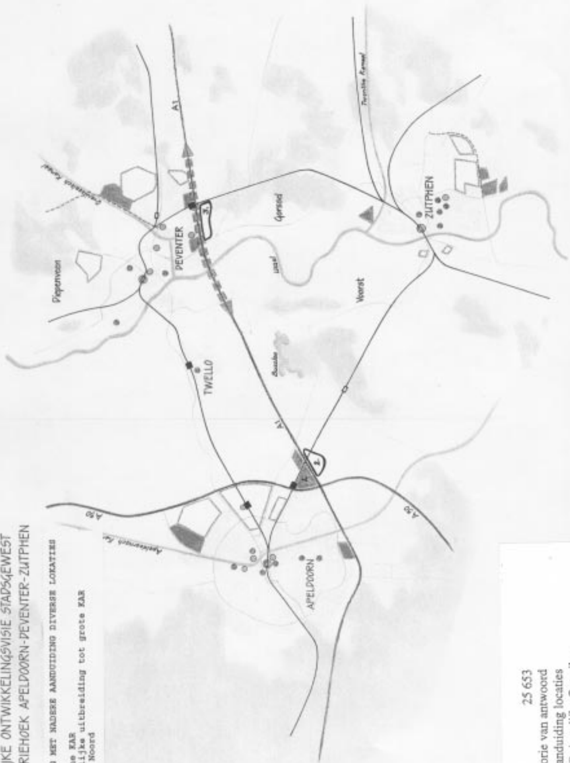
Bijlage 2 25 653 Nadere memorie van antwoord Indicatieve aanduiding locaties op plankaart Ruimtelijke Ontwik- kelingsvisie Stedendriehoek